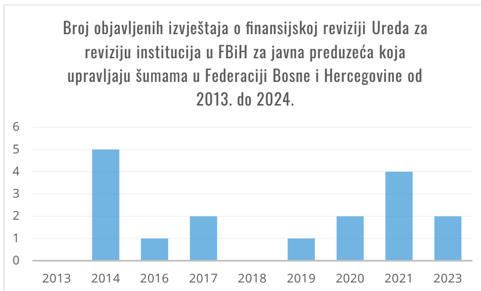
Grafikon 2 Izvještaji o finansijskoj reviziji Ureda za reviziju institucija u Federaciji Bosne i Hercegovine za javna preduzeća koja upravljaju šumama u Federaciji Bosne i Hercegovine od 2013. do 2024..

Osim toga, VRI – posebno u FBiH – nemaju dovoljno kapaciteta za redovno provođenje finansijskih revizija ili drugih revizorskih aktivnosti nad javnim preduzećima, što je vidljivo iz dinamike objavljivanja revizorskih izvještaja, koja je neujednačena i neredovna, naročito imajući u vidu društveni i privredni značaj ovih preduzeća.