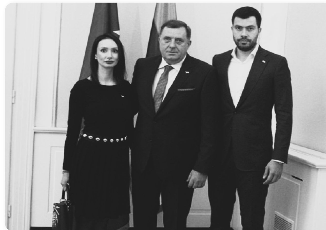
Milorad Dodik, tadašnji član Predsjedništva BiH, kog je TI BiH prijavio zbog sukoba interesa jer firme u vlasništvu njegove porodice posluju sa državom i primaju značajne podsticaje iz budžeta.

Pripremljena i objavljena analiza zakonskog okvira koji reguliše pitanje stvarnog vlasništva u BiH. Rezultati analize i preporuke proizašle iz analize će poslužiti za daljnje zagovaračke aktivnosti vezane za uspostavu jedinstvenog registra stvarnog vlasništva u BiH, u skladu sa međunarodnim standardima.