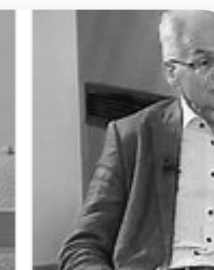
EP8 Trailer3 I

Broj prikaza: 20.6K · 6 months ago YouTube › Pretres Podcast