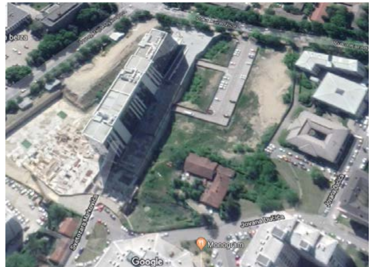
Slika br.4 - Kompleks Grand Tradea

Javni put iz pravca ulice Svetozara Markovića koji je još uvijek vidljiv na fotografiji 1, a koji je ova porodica koristila više od 50 godina, uvršten je regulacionim planom u kompleks parcele koja je dodijeljena Grand Tradeu. Porodica Vulić u pismu gradonačelniku Dragoljubu Davidoviću zatražila je da se prilaz njihovim nekretninama obezbijedi iz postojeće ulice Svetozara Markovića, ali su dobili odgovor od strane RUGIP-a krajem 2009. godine da se taj put površine 261 m 2 spaja sa zemljištem koje je u vlasništvu preduzeća Grand Trade.