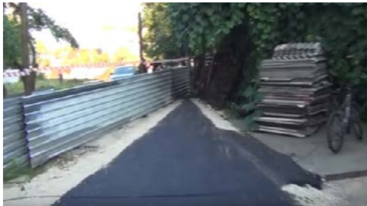
Slika br.5 - Alternativni pristupni put

“Grand trade” objekat izgradio na zakonit način,