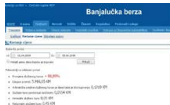
Slika br. 7 - Podaci sa banjalučke berze

Da stvar bude gora, cijena akcija je snižena fiktivnim trgovanjem male vrijednosti u ukupnom iznosu od oko 5.900 KM. Ova igra nije bila bezazlena, jer prema Zakonu o preuzimanju akcionarskih društava cijena koju ponuđač plaća zavisi od kretanja cijena akcije na berzi u posljednjih 6 mjeseci. Tako da očigledno motiv fiktivnog trgovanja malim brojem akcija u kojem su povezana lica međusobno prodavala i kupovala udjele, nije bio sticanje vlasništva nego snižavanje cijene. Da nije bilo ovih transakcija, Akcijski fond Republike Srpske kojim upravlja IRB RS, umjesto za 140.000 KM prodao bi svoj paket za 1,2 miliona KM.