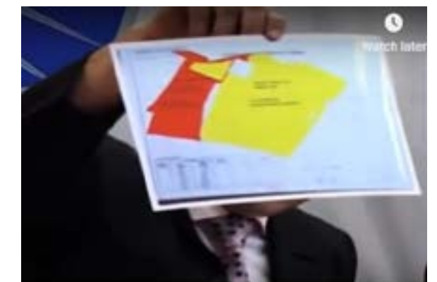
Slika br 8- Press konferencija MUP RS

U septembru te godine dvojica optuženih Cerovac i Bajić priznali su krivicu i sklopili nagodbu sa Tužilaštvom kojim su se obavezali na dalje svejdočenje protiv prvooptuženih u ovom predmetu.