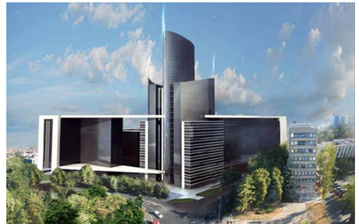
Slika br.6 - plan daljeg širenje objekta Grand Tradea

Ipak uprkos dobrim uslovima, stručnim kadrovima i djelatnošću koja godinama predstavlja unosan posao na našem tržištu,