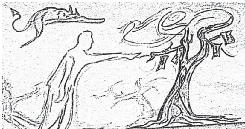
Crtež na osnovu kojeg sam napravila prikaz ljudske halapljivosti

Ipak mi smo ili plijen ili lovina. Lanac preživljavanja se zna, kao i to da se u moru nalaze ajkule koje kao hladnokrvne halapljivice svoj plijen raskomadaju i hrane se. Tako i ljudska čula reaguju kada namirišu položaj, kada imaju moć. Kao usnuli u svome snu i krenuli da mjesečare, hodaju ka cilju koji potajno prikrivaju ispod svoje maske koju stavljaju svako jutro ispred ogledala, ne vidjevši više svoj lik, nemajući savjesti koja će ih održavati na rubu. Na rubu i ivici po kojoj koračaju. Čak i da kroz mjesečevu maglu hodaju, po nepoznatim ulicama u potpunoj tišini, oni sanjaju svoja postignuća. Ili pak neke samožive samo svojoj svrsi shodne ciljeve koje laktanjem kao borba u živom blatu se bore. Pa me je takav način viđenja inspirisao na malu ilustraciju.