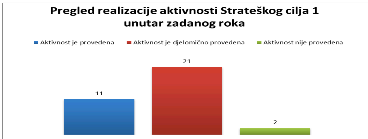
Grafikon broj 1 Pregled provođenja aktivnosti iz Strateškog cilja 1 unutar roka od dvije godine nakon usvajanja Strategije

Broj aktivnosti koje se trebaju provesti unutar zadanog roka (aktivnosti sa rokom provedbe od 6 mjeseci po usvajanju Strategije, 9 mjeseci po usvajanju Strategije, godinu dana nakon usvajanja Strategije i druga godina nakon usvajanja Strategije) je ukupno 34.