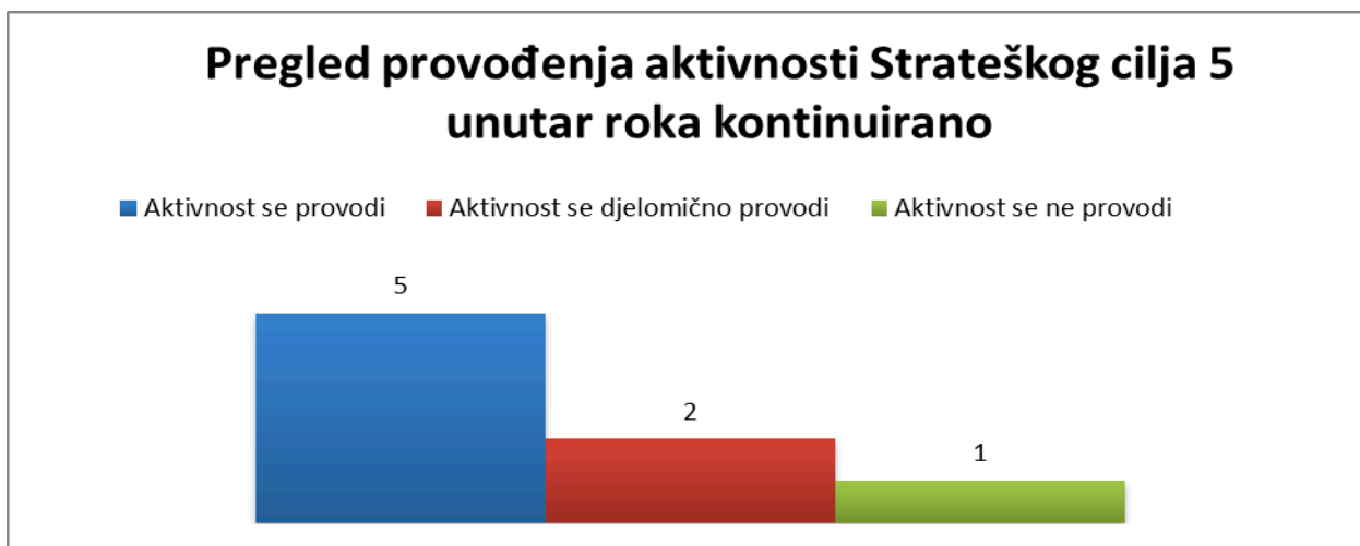
Grafikon broj 9 Pregled provođenja aktivnosti iz Strateškog cilja 5 unutar zadanog roka unutar roka kontinuirano

Podaci iz grafikona 8 ukazuju da su 3 aktivnosti (43%) provedene do sada, dok je njih 4 (57%) samo djelimično provedeno.