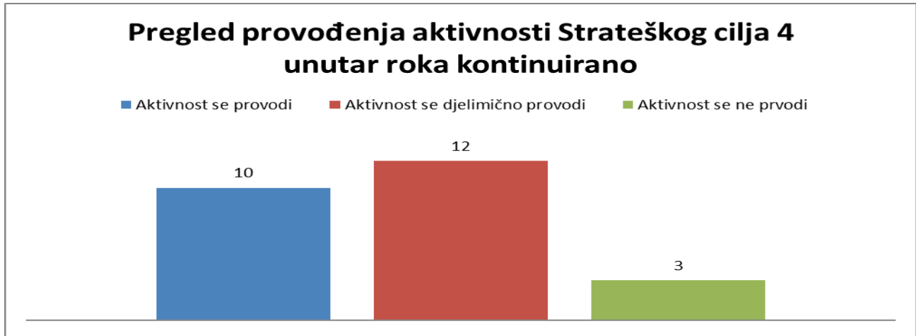
Grafikon broj 7 Pregled provođenja aktivnosti iz Strateškog cilja 4 unutar roka kontinuirano

Podaci iz Grafikona broj 6. pokazuju da je 5 aktivnosti (26%) provedeno na zadovoljavajući način, 9 aktivnosti (47%) je djelimično provedeno, te 2 aktivnosti, odnosno 11% nisu uopće provedene