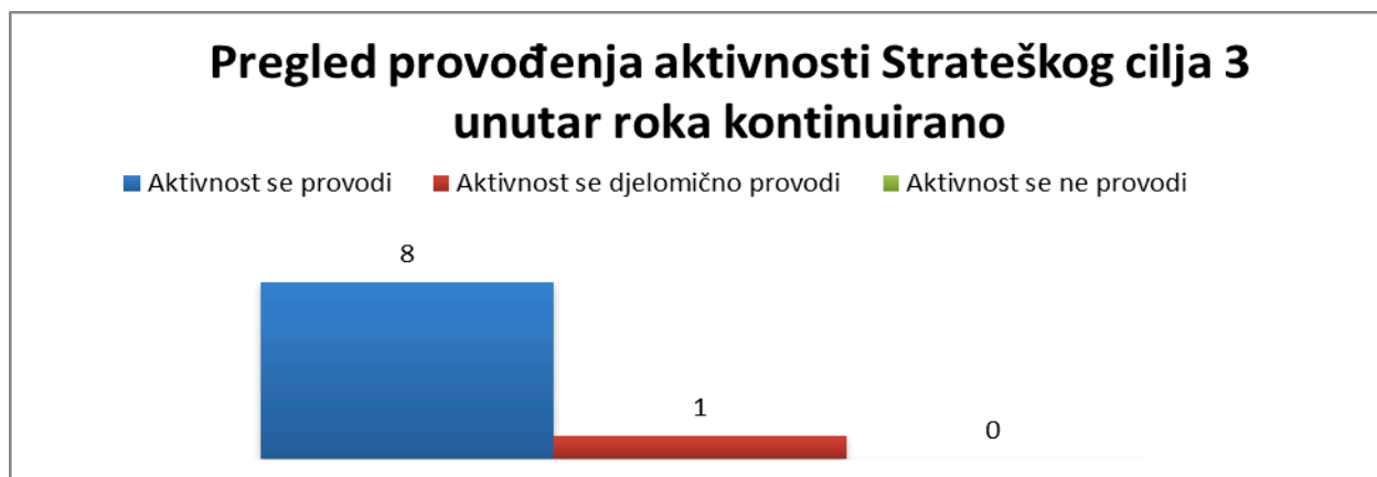
Grafikon broj 5 Pregled provođenja aktivnosti iz Strateškog cilja 3 unutar roka kontinuirano

Broj aktivnosti koje se trebaju provoditi sa rokom kontinuirano nakon usvajanja Strategije odnosno kontinuirano nakon prve godine od usvajanja Strategije unutar Strateškog cilja broj 3 je 9.