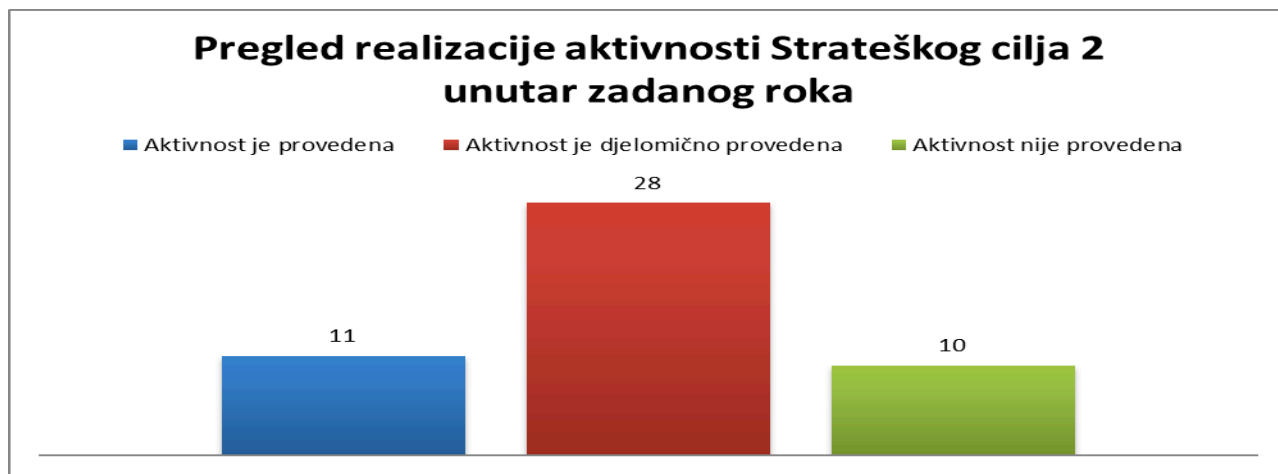
Grafikon broj 2 Pregled provođenja aktivnosti iz Strateškog cilja 2 unutar roka od dvije godine nakon usvajanja Strategije

Broj aktivnosti koje se trebaju provesti unutar zadanog roka (6 mjeseci po usvajanju Strategije, 9 mjeseci po usvajanju Strategije, godinu dana nakon usvajanja Strategije i druga godina nakon usvajanja Strategije) je ukupno 49.