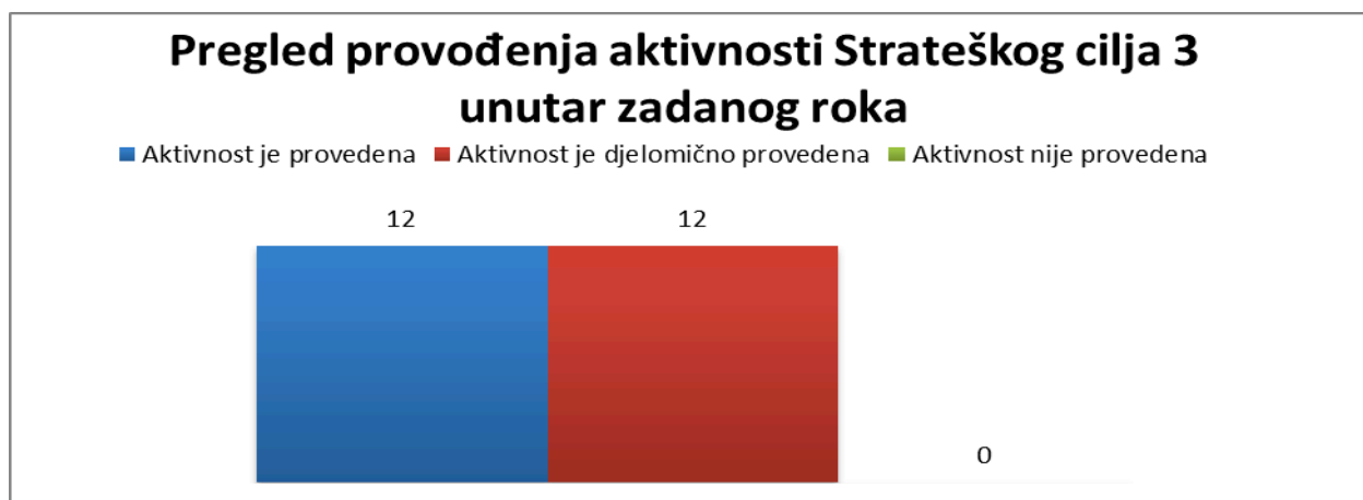
Grafikon broj 4 Pregled provođenja aktivnosti iz Strateškog cilja 3 unutar roka od dvije godine nakon usvajanja Strategije

Analizom realizacije provođenja aktivnosti unutar Strateškog cilja 3 sa jasno utvrđenim rokom za izvršenje procijenjeno je da je 12 aktivnosti ili njih 50% provedeno, dok je također njih 12 ili 50% djelimično provedeno.