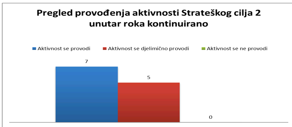
Grafikon broj 3 Pregled provođenja aktivnosti iz Strateškog cilja 2 unutar roka kontinuirano

Prilikom analize realizacije aktivnosti Strateškog cilja 2 sa rokom dvije godine nakon usvajanja Strategije, vidljivo je da je samo 11 aktivnosti ili 22.5% u potpunosti provedeno, dok je i u ovom slučaju najveći broj njih 28 ili 57% djelimično provedeno. Takođe, 10 aktivnosti odnosno 20% nije uopšte provedeno.