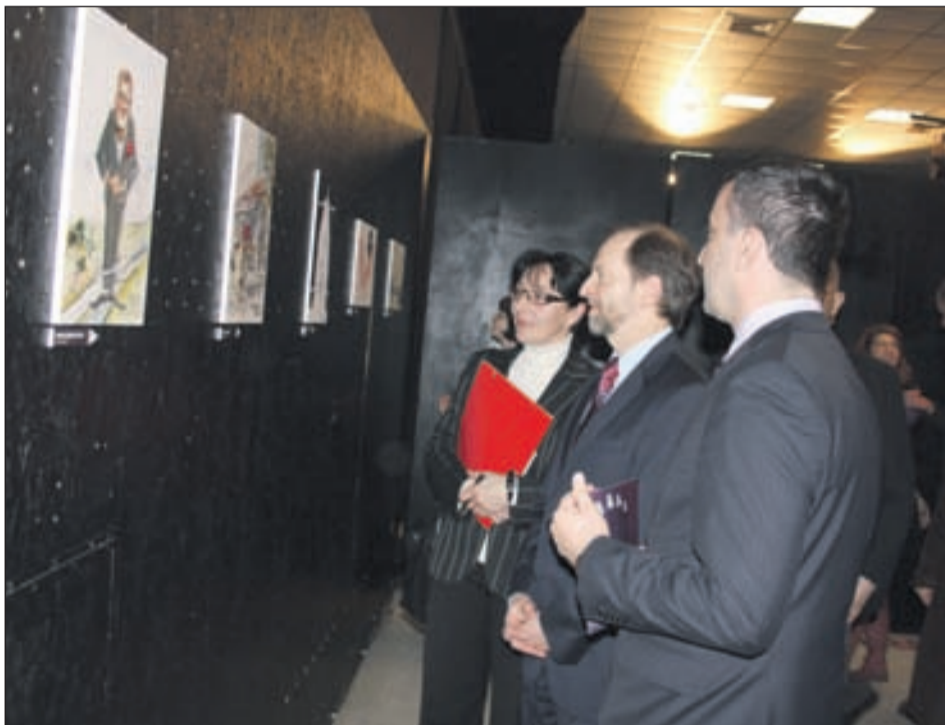
Sinoć u OKC „Abrašević“: Važna uloga građana

po bh. društvo, a koje su nastale kao rezultat takmičenja projekta koji su zajednički organizirali Ambasada SAD-a i Transparency International (TI) BiH. On je naveo da je