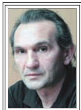
Piše: Ruždija ADŽOVIĆ

Odajući utisak konfuznog, nepripremljenog i umornog čovjeka koji je dva čeka kraj mandata na sadašnjoj funkciji, Bramerc je kao najveći rezultat svoje jalove posjete apostrofirao činjenicu da je od svih sagovornika u bh. prijestonici tražio da se uhapsi odbjegli ratni