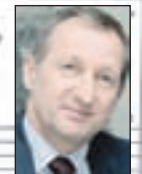
Mašić: Brojne nekretnine

Inače, mnogi čelnici ove kompanije u prethodnim godinama stekli su pod vema sumnjivim uvjetima stanove u zgradi u Paromlinskoj ulici, koju su radnici „Hidrogradnje“ i izgradili.