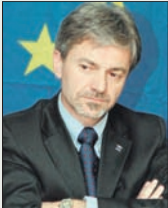
Davidi: Uskoro sastanak na najvišem nivou